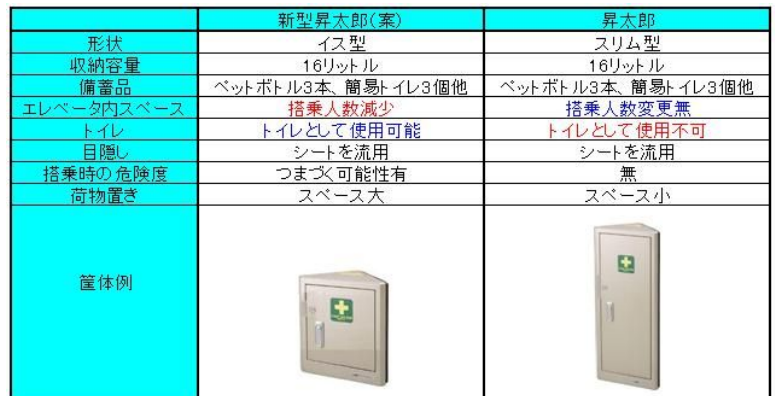
救命ボックス形状アンケート

アンケート回答数は、1,606件と大変多くの方に回答をいただきました。参考意見大変ありがとうございます。